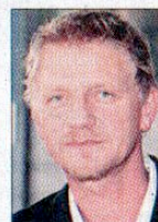
Bekannter Juror: Sönke Wortmann.