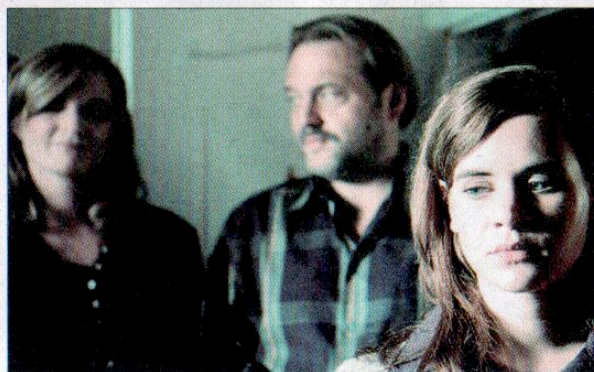
Das Leben der Familie König: zerbrochene Idylle, „Ein blinder Fleck“.

„Der blinde Fleck“, Mo, 21.30 Uhr, MaxX 4 und Do, 16.30 Uhr, MaxX 4. „Sieben Tage Sonntag“, Sa, 22 Uhr, MaxX 2 und Mo, 14 Uhr, MaxX 4