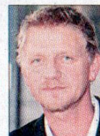
Bekannter Juror: Sönke Wortmann.