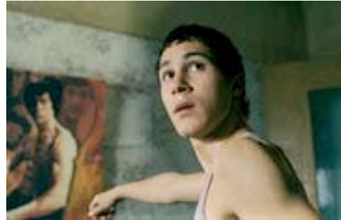
"Sieben Tage Sonntag" überzeugte die Mentor Stiftung